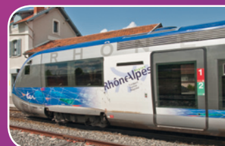
Autorail X73500 en service dès décembre 2009