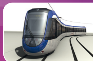
Prototype du tram-train en construction à Valenciennes

Grâce à la mise en place d'un matériel roulant pratique, non-polluant, favorisant l'éco-mobilité.